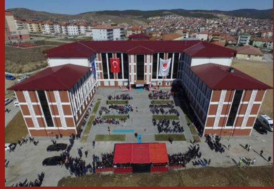
Akdağmadeni Meslek Yüksekokulu

ihtiyacı hissettim. Sonrasında hemen müdürler toplantısı yaptım ve istişare edip, Rektörümüzle durumu görüştüm. Derslerin yerleri, içerikleri tam ve yeterliydi, ancak bir birliktelik yoktu. Çünkü bir meslek yüksekokulunda öğrenciye verilen ders yükü, 120 AKTS'ye denk geliyor ve bu dersleri veren üç tane hoca vardı, fakat diğer meslek yüksekokulları toplamında aynı bölümlere bakınca dokuz tane hoca vardı. Uzaktan eğitimde yüzde kırka kadar ortak ders verilebiliyorsunuz. Mekan problemi de olmadığına göre, o zaman üç tane meslek yüksekokulunun aynı bölümlerinde ders veren hocalarımız üçten dokuzca çıktı. Şimdi hangi açıdan bakarsanız bakın, ister ülke ekonomisi açısından, ister öğrenciye hizmet verme açısından, ister öğrenciye daha fazla bilgi verme açısından ya da hocalarımızın uzmanlaşmaları açısından bakın bu müthiş bir kazanım. Böylece öğrenci, aynı anda farklı hocaları görme imkânı bulacak. Ayrıca üç hocayla açılacak seçmeli ders sayısı dokuz hocayla açıldığında ders sayısı da artacak. Uzmanlaşmanın, öğrencinin daha fazla bilgi edinmesi, daha fazla imkân sağlaması, hocaların gelişmesi ve daha fazla akademik üretimi noktasında büyük gelişimler sağlayacağını düşündük ve bu şekilde çalışmalara başladık. Yani MYO'ların her biri kendi başına, idareciyle, öğrencisiyle yönetilme noktasındaydı. Bu aralarında etkileşimin olmadığını gösteriyordu. Bu kopukluk aslında farklı anlamlarla da eşitsizliklere neden olabiliyordu. Belki de sadece Yozgat Bozok Üni-